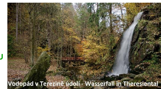
Vodopád v Terezíně údolí - Wasserfall in Theresiental