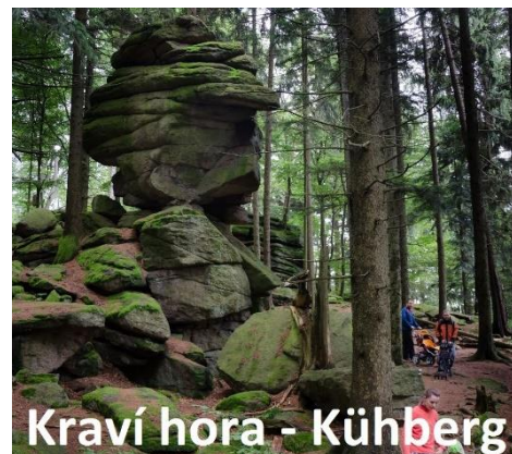
Kraví hora - Kühberg

www.novehrady.cz vladimirh@novehrady.cz Nám. Republiky 46, 373 33 Nové Hradý