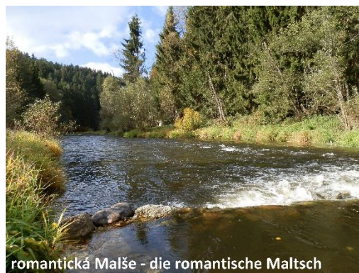
romantická Malše - die romantische Maltsch

www.pomalsi.cz Římov 2, 373 24 Římov starosta@rimov.cz