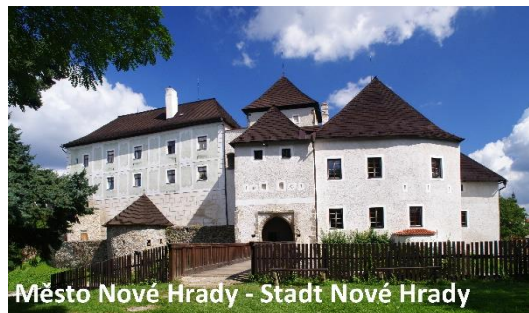
Město Nové Hradý - Stadt Nové Hradý