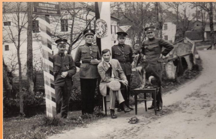
Cetviny – Hammern 1927

S Mnichovským diktátem z 1.10.1938 se Cetviny staly součástí Německé říše, župy Horní Dunaj.